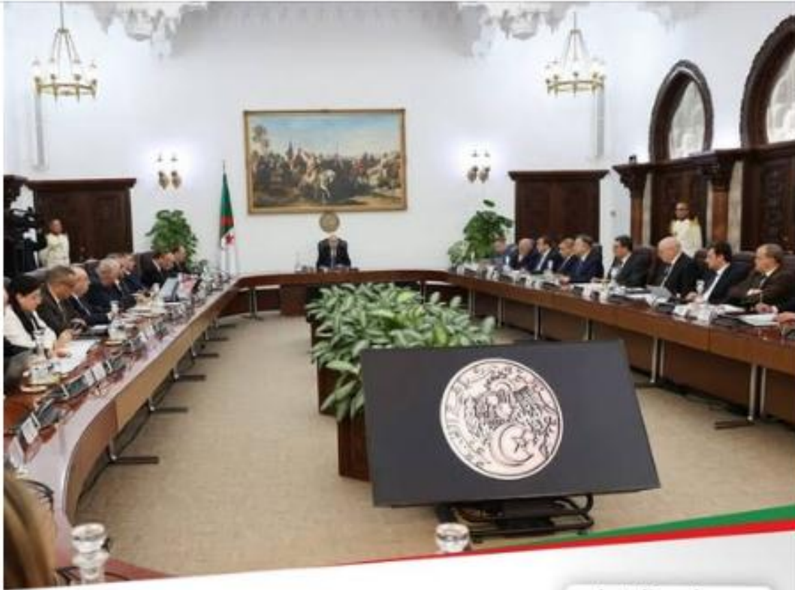
◀ مجلس الوزراء

رئيس الجمهورية يأمر بإعادة النظر في تسيير الجزائرية للمياه وعصرنتها وفق منطق النجاعة